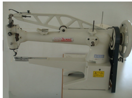
2973 cylinder cm. 44