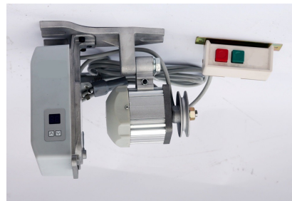
Engine v.220 electronic option