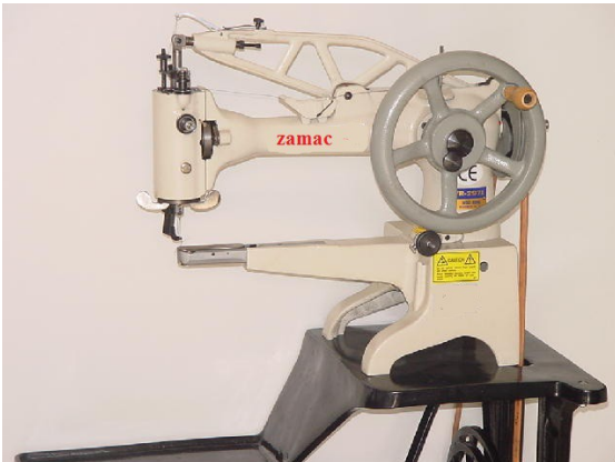
2971 cylinder cm. 31